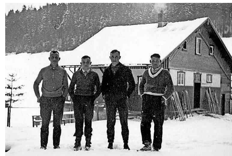
Dieses Foto entstand zu Beginn der 30er Jahre. Damals war die Dürre Wiese der erste Torlaufhang des Wintersportvereines Steinach.

Privatbrauerei Gessner GmbH & Co KG., Sonneberg-Malmerz