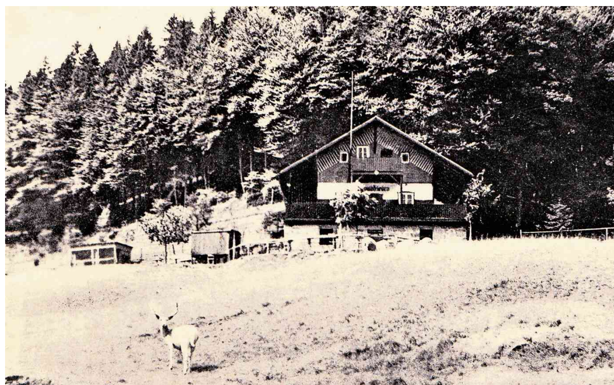
Historische Aufnahme aus dem Jahre 1931.