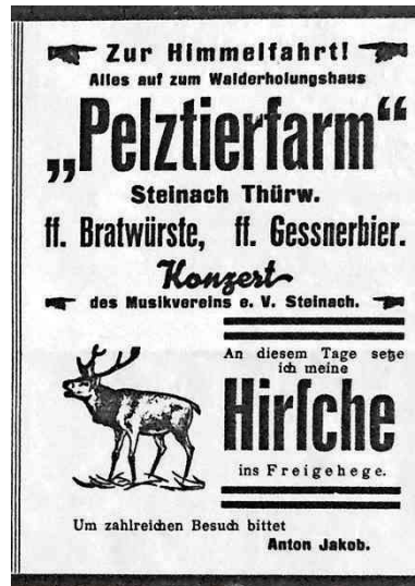
Diese Anzeige aus dem Jahre 1931 war in der Heimatzeitung veröffentlicht.