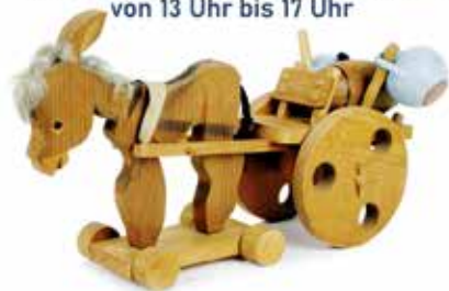
Alt Kurt Baumgarten-Museum und Sammlung Weidner – mechanische Spielzeuge

Öffnungszeiten: Freitag bis Sonntag von 13 Uhr bis 17 Uhr