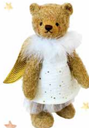
Engel Bella 22 cm Limit 150 Stück Aktionspreis € 114,--