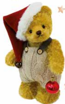
Weihnachtstедdy Jack 23 cm Limit 100 Stück Aktionspreis € 114,--