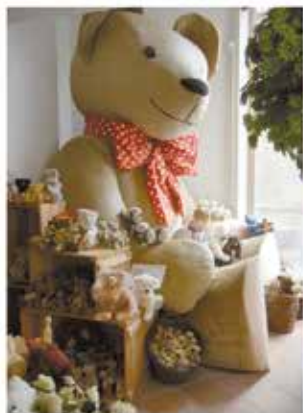
Der größte Teddybär der Welt begrüßt unsere Gäste

Traditionelle Handarbeit seit 5 Generationen Sammlebären | Holzwoollbären | Traditionsbären Filzbären | Jahresbären | Teddybastelsets | Unikate