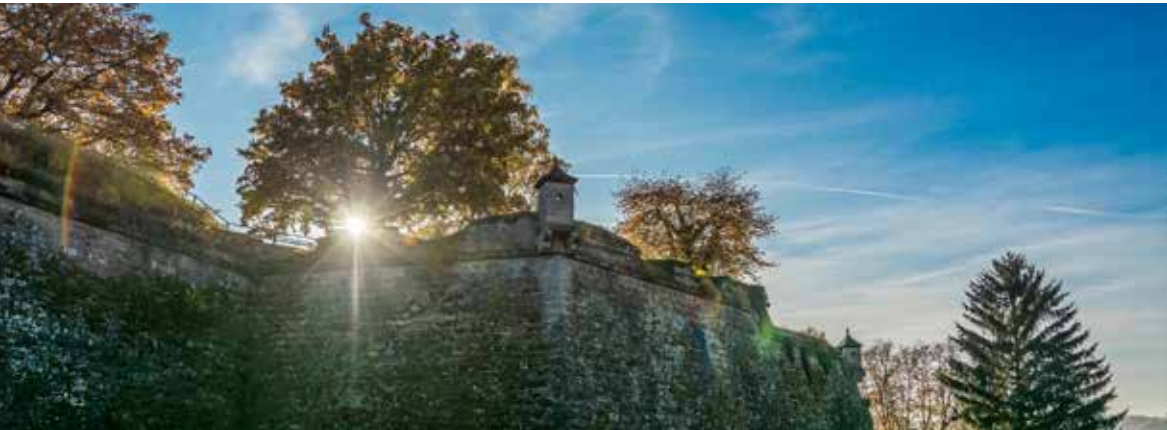
Denkmal Wahrzeichen Museum

Steil über der Altstadt von Kronach erhebt sich die ehemalige Bambergische Bischofsburg und spätere Landesfestung auf dem Rosenberg. Die Ursprünge des befestigten Rosenbergs liegen nach wie vor im Dunkel des Hochmittelalters. Fest steht: Das älteste erhaltene Dokument, das den Namen „Rosenberg“ erwähnt, stammt aus dem Jahr 1249. Mit ihren 23,6 Hektar gilt die Festung als eine der größten Befestigungsanlagen Deutschlands. Das Festungspentagon mit seinen fünf mächtigen Bastionen umschließt bis heute den über Jahrhunderte entstandenen Komplex aus Mauer-, Graben-, Gebäude- und Toranlagen vollständig. Deutlich ablesbar sind die verschiedenen Bauphasen, die vom mittelalterlichen Bergfried über den Ausbau des 15. und 16. Jahrhunderts zum Renaissanceschloss bis hin zu der beeindruckenden bastionären Festung des fränkischen Barock reichen. Nie zerstört, bietet die Festung Rosenberg die faszinierende Möglichkeit, sich beispielhaft die rasante Entwicklung des Wehrbaus im Wettlauf mit der „ars militaria“